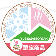
ゆざわジオパーク認定商品ロゴマーク

ゆざわジオパーク認定商品ロゴマークのモチーフは「 地熱 」と「 豪雪 」です。 【 地熱 】は温泉や景勝地などの観光資源と、地熱発電という未来につながるエネルギーを生み出します。